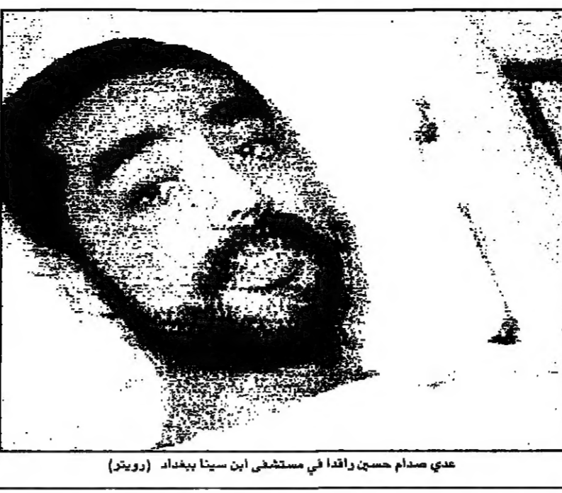
عدي صدام حسين واقدا في مستشفى ابن سينا ببغداد

القريب، وازالتهما يمكن ان تؤدي اما الى الوفاة او الخلل الكلي. واشارت الصحفية الى ان عبد الله السامرائي عضو مجلس قيادة الثورة وعضو الفريق الحاكم كان في عملية اغتيال لطاق خلايا بوليسية 68 رسامة استقرت في جسد - وكانت كسلة انه قتل في حادث مؤسف. ويؤكد ان مقدي الهجوم يتختمون الى المعارضة الخفية، واولوا الانتقام من دور السامرائي في فتح الكفاحية الجيوب التي اندلعت لثاء الهجوم الجوي على بغداد ومن العراق الاخرى. واحد ان محمد حمزة الزبيدي رئيس الوزراء الاسبق (عام 1992) تعرض ايضا لمحاولة اغتيال ولكنه نجا منها. واظهر العديد من العراقيين بان عملية الاغتيال هذه - تشكل عبء لخبرتي للامن العراقي حتى الان - وقالوا انه اذا تكبد فلان ان الزبيدي تعرض لمحاولة اغتيال، فهذا يعني ان الاغتيال خطير جدا. وقالت مصادر فرنسية في عمان ان السلطات العراقية لم تقدم باي طلب رسمي الى فرنسا لتقل عدي للعلاج في باريس، ولجأت الى تسيير ابناء الى صف عربية للقياس رد الفعل الفرنسي، وقد بادرت الحكومة الفرنسية بطلب سريعا على هذه الرسالة العراقية غير المباشرة برفض استقبال عدي - ويرتد رد الفعل الفرنسي هذا بالقول ان الحكومة الفرنسية تعرضت لانتقادات كثيرة عندما استقبلت زكريا الكركي احد ضباط الحرس الجمهوري الملاح، وقال مقننوها ان هناك آلاف العراقيين الذين هم بحاجة الى علاج في فرنسا وغيرها من نفس الدولة بطل الحصار، فقامت فرنسا بفرنسا لروكاف لفة وبجاجة فيها. وقالت هذه المصادر ان الحكومة الفرنسية قررت الاتقانات مماثلة من قبل المعارضة والجهزة الاعلام - ويتواجد في بغداد حاليا طيربين فرنسيين متخصصين في جراحة الاعصاب للانراف في علاج عدي، يعتقد انها ذهبا الى هناك ضمن فريق من اربعة اطباء عاد منهم اثنان الى باريس يوم الاثنين